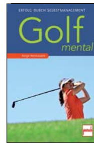
Golf mental: Erfolg durch Selbstmanagement pietsch 2014 136 Seiten, 19,95 EUR

Ihr Anliegen ist es, Ihre persönlichen Erfahrungen im Mental Coaching von Menschen weiterzugeben. Persönlichkeitstraining und -entwicklung macht Spaß, weckt Lebensfreude und eröffnet den Zugang zu versteckten Ressourcen in uns.