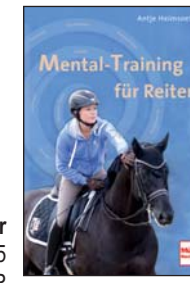
Mental-Training für Reiter Müller Rüschlikon 2015 176 Seiten, 19,95 EUR