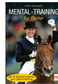
Mental-Training für Reiter Müller Rüschlikon 2008 208 Seiten, 24,90 EUR