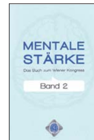
Antje Heimsoeth in Mentale Stärke Verlag für Mentale Stärke 227 Seiten, 19,00 EUR