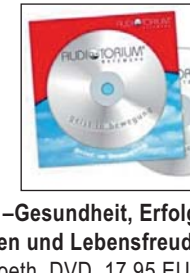
Mentale Gesundheit –Gesundheit, Erfolg, Selbstvertrauen und Lebensfreude Antje Heimsoeth, DVD, 17,95 EUR