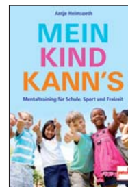
Mein Kind kann's – Mentaltraining für Schule, Sport und Freizeit pietsch 2013 176 Seiten, 19,95 EUR